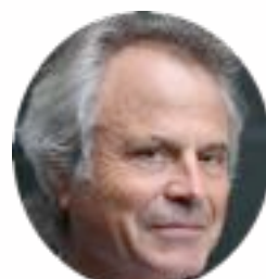
FRANZ-OLIVIER GIESBERT L'ARRACHEUSE DE DENTS GALLIMARD