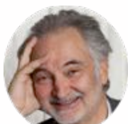
JACQUES ATTALI PEUT-ON PRÉVOIR L'AVENIR ? FAYARD